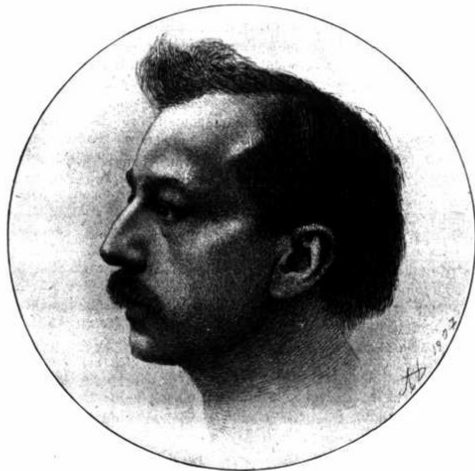
D'après une eau-forte d'Aug. DANSE.

Très épris du xv e siècle italien, DESTREE consigna en des pages qui resteront parmi les plus billantes de la littérature belge, ses impressions d'artiste. Tour à tour, il étudia les peintres de Toscane, de Sienne, de Marche et d'Ombrie, décrivant avec une rare maîtrise